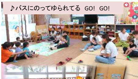
大鐸こども園のおともだちといっしょに!