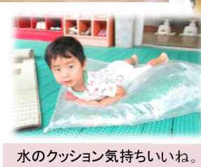
水のクッション気持ちいいね。