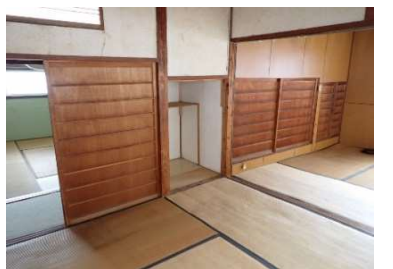
和室4.5畳①及び和室4.5畳②