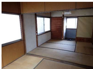
和室4.5畳①及び和室4.5畳②