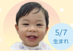
5/7 生まれ さいき そうま 佐伯 颯真くん 毎日元気に過ごしているね。たくさん外に出て、毎日お散歩しようね。