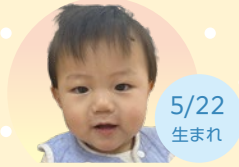
5/22 生まれ かわはら あおい 河原 碧生くん お兄ちゃん、お姉ちゃんに負けないようにたくましく育ってネ！