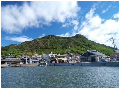
皇踏山(おうとざん) モンベルとの連携 ハイキングコース