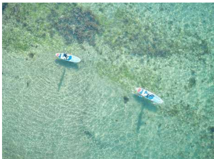
SUP シマアソビとの連携 アウトドア体験会