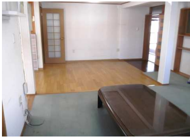
洋間及びフローリング