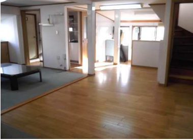
洋間及びフローリング