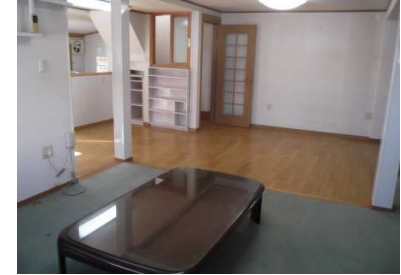
洋間及びフローリング