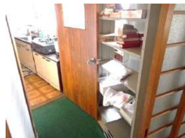
通路(和室36畳とキッチンの間)