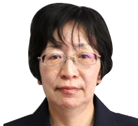
鈴木 美香（57歳） 立憲民主党