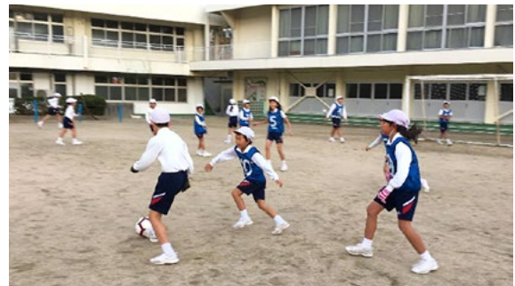
▲みんなでボールを追いかける！

そして、4月12日は小豆島スポーティーズと契約をしたプロバスケットボール選手の近選手と一緒に行ってきました。この日はもちろんバスケットボールの練習です。普段なかなか触れ合うことがないプロ選手と交流ができたことで子どもたちも大いに喜んでくれていました。こんな機会をこれからも作っていかれたらなと思っています。