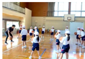
▲憧れのプロバスケットボール選手と交流しました