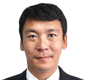
福本 耕太（40歳） 日本共産党