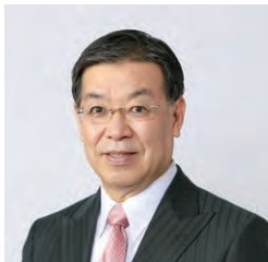
講師 山田 啓二 京都産業大学 学長補佐 (法学部 教授) (前京都府知事)