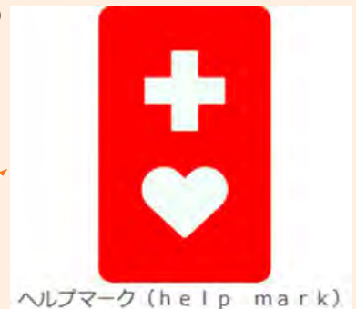
ヘルプマーク (help mark)