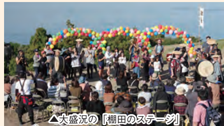
△大盛況の「棚田のステージ」

11月2日、豊島「食プロジェクト」推進協議会、唐櫃棚田保存会、町の地域おこし協力隊が主催する「豊島棚田の収穫祭」が開催されました。秋晴れとなった当日、会場には多くの参加者が訪れ、棚田の散策や稲刈り体験、わたつみ体験、豊島の小中学生や小豆島中央高校吹奏楽部、瀬戸内国際芸術祭サポーターこえび隊などによる「棚田のステージ」を楽しみました。そして、棚田の新米や地元の郷土料理などが楽しめる「棚田のマーケット」でお腹も心も満ちました。瀬戸内の海、日本の原風景ともいえる棚田、そして現代アートが溶けこんだ景観は豊島にしかない魅力のひとつ。この収穫祭では、多くの人が「また訪れたい」島の魅力を満喫しました。