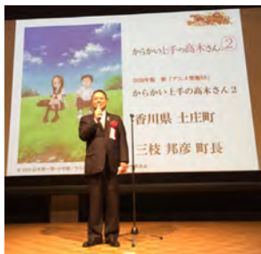
▲10月29日、東京都で行われた認定証贈呈式