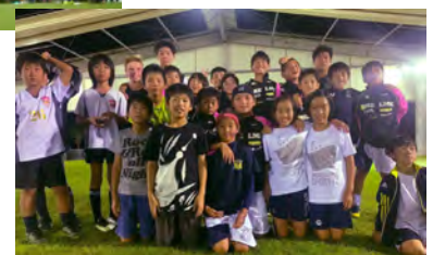
▲プレーを楽しむ 子どもたちの姿