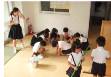
豊島小学校 児童会

私たちは、この活動を「朝カツ」と呼ぶことにしました。この「朝カツ」が何年も続いて豊島小学校の伝統になってほしいです。そのために、私たち5・6年生が先頭に立って取り組みたいと思います。