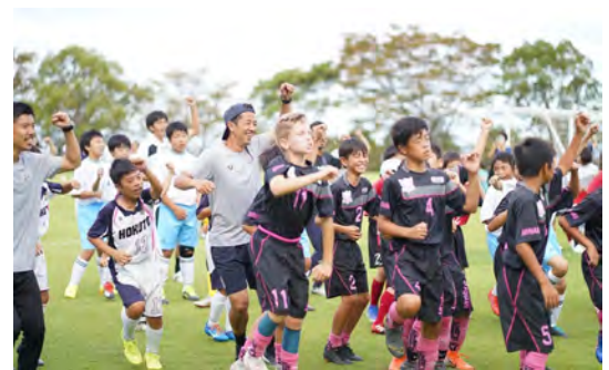
▲海外の選手たちと同じフィールドで

また、初日の夜はBBQをしながらの交流会を実施し、島の子もたちがオーストラリアの選手たちとジェスチャーや表情を使って工夫しながらコミュニケーションをとっていた姿が印象的で、今後の成長のきっかけになってくれたらなと感じました。また来年も更にグレードアップして開催したいと思います！