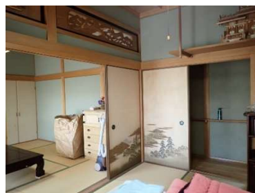
和室6畳②及び和室8畳