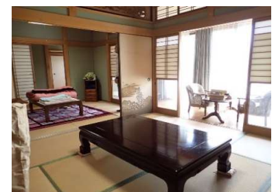
和室6畳②及び和室8畳