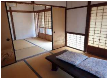
和室4.5畳①及び和室4.5畳②