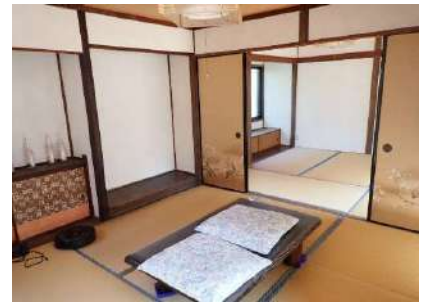
和室4.5畳①及び和室4.5畳②