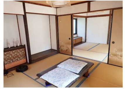
和室4.5畳①及び和室4.5畳②