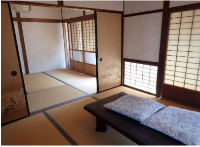
和室4.5畳①及び和室4.5畳②