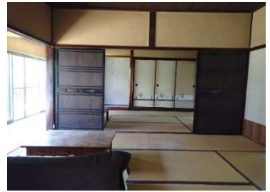
和室6畳①及び和室6畳②