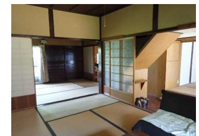
和室6畳①及び和室6畳④