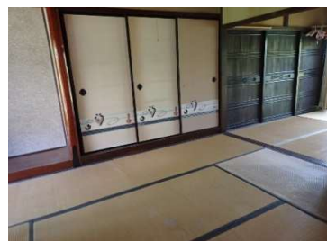
和室6畳②及び和室6畳③