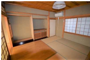
1F和室8帖(フローリング+畳)