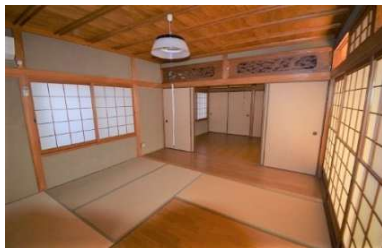
1F和室8帖(フローリング+畳)