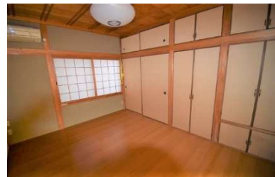
1F 和室6帖(フローリング)