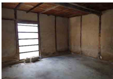
土間6畳(コンクリート)