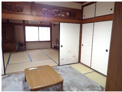
和室6畳①及び和室8畳