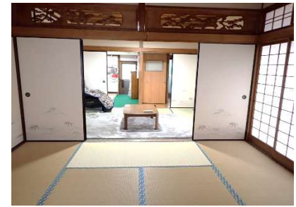
和室8畳及び和室6畳①