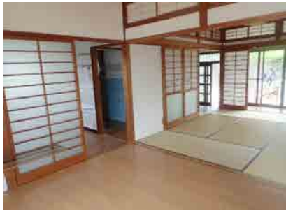
洋間4.5畳①及び和室6畳①