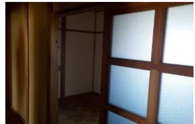
フローリング(物置)