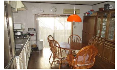
ダイニングキッチン