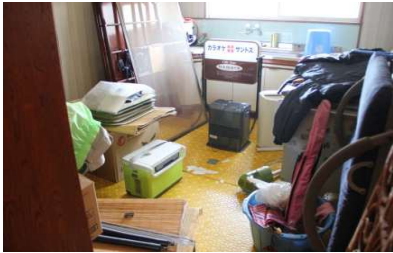
ダイニングキッチン