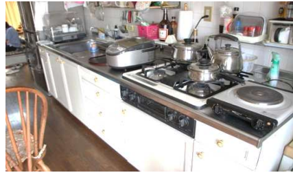
ダイニングキッチン