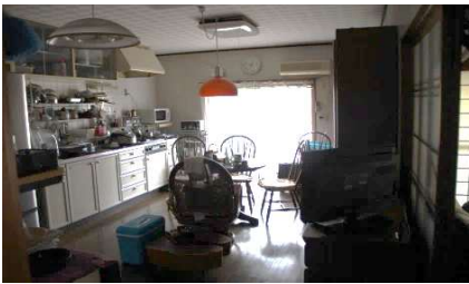
ダイニングキッチン