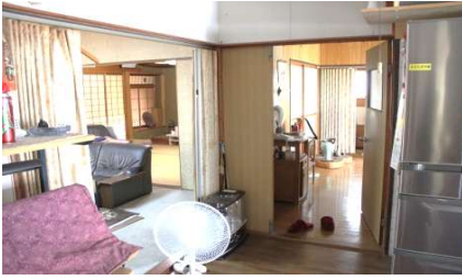
ダイニングキッチン