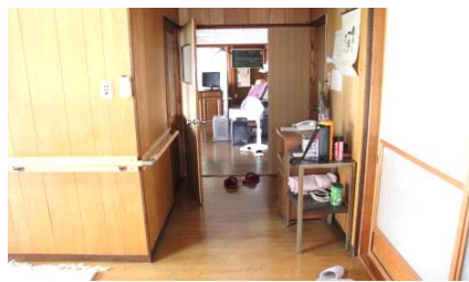
玄関からキッチン