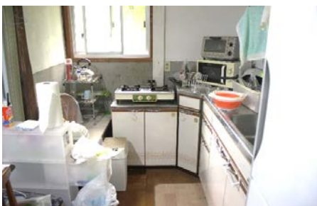
流し台及びコンロ