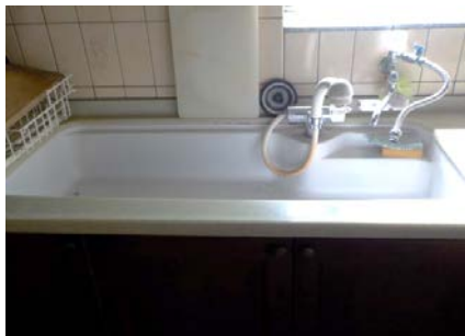
ダイニングキッチン