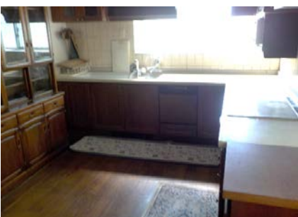
ダイニングキッチン