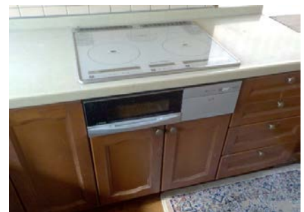
ダイニングキッチン