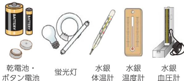
乾電池・ ボタン電池