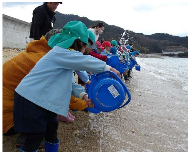
四海漁業協同組合の放流事業