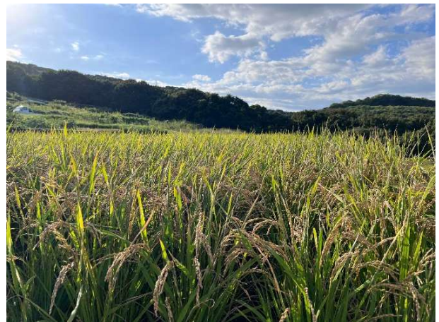
景観維持や水稻栽培