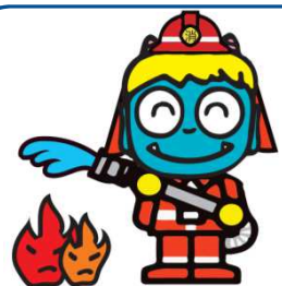
消防団員応援制度キャラクター 「青鬼団長くん」

〒761-4192 土庄町役場 総務課 消防団担当 TEL：0879-62-7000 FAX：0879-62-4000 E-mail：soumu@town.tonosho.lg.jp