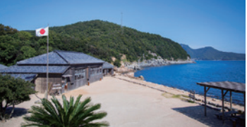
電影「二十四之瞳」的拍攝地。現為日本電影和文學的主題公園，園內有藝術祭作品等多處拍照景點。