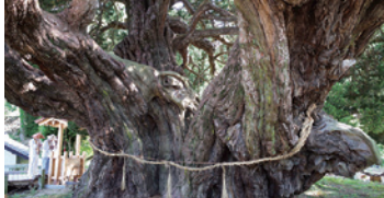
國家指定特別天然紀念物，樹齡超過1600年柏樹。樹根覆蓋範圍周長約16.9m，樹高約20.9m。