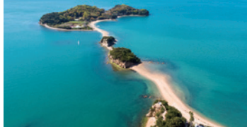
隨著潮起潮落，步道時隱時現。傳說與喜歡的人一起牽手走完，就能實現願望的戀人聖地。