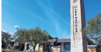
「大坂城石垣切割與運輸的採石場遺址及小海殘石群」歷史遺跡。展示珍貴的當時資料、工具。