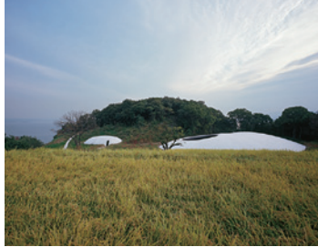
由藝術家內藤禮、建築師西澤立衛所共同設計。建於山丘上，能將瀨戶內海的美景盡收眼底。