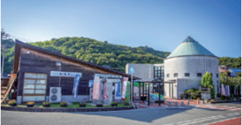
被選為「日本夕陽百選」，提供各種手作體驗及水上活動的綜合設施。