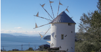
位於能眺望瀨戶內海的小山丘，一望無際的橄欖樹園和白色希臘風車是絕佳拍照景點。