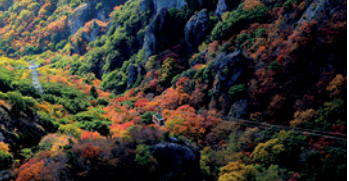
日本三大溪谷美景之一，推薦搭乘空中纜車，眺望這世界聞名的旅遊勝地。