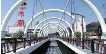
金氏世界紀錄認定為世界上最窄的海峽，最窄處僅有9.93m。開具橫渡海峽證明(收費)。