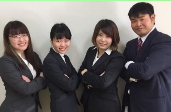
香川大学 経済学部 学生プロジェクト なえどこ